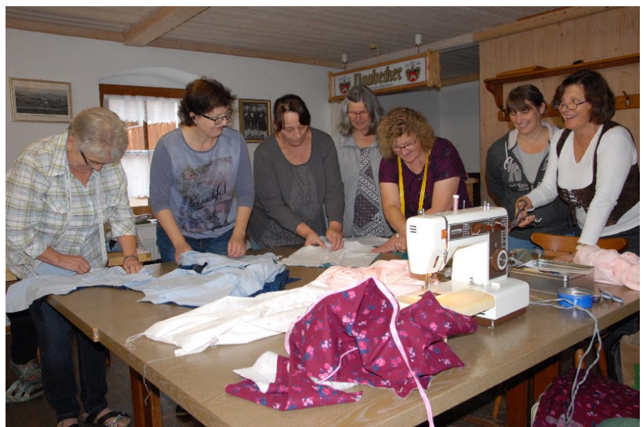
Frauen von Trachtenvereinen aus der Oberpfalz kamen zum Trachtennähkurs nach Schmidmühlen. Gemeinsam geht es eben besser.

Gepflegt gekleidet von Kopf bis Fuß Und ohne Kopfbedeckung geht man gar nicht hinaus. Hier hat man bei den Schmidmühlener Trachtlerinnen bereits in den letzten beiden Jahren fleißig gearbeitet. In Schmidmühlen trägt man die Bänderhaube – in Schwarz mit schwarzen Spitzen für die verheirateten Damen, in Rot mit weißen Spitzen für die ledigen Mädchen – oder die kostbar gestickte Riegelhaube. 25 bis 30 Stunden Arbeit haben die Frauen in das Nähen und die aufwändige, goldene Stickerie gesteckt.