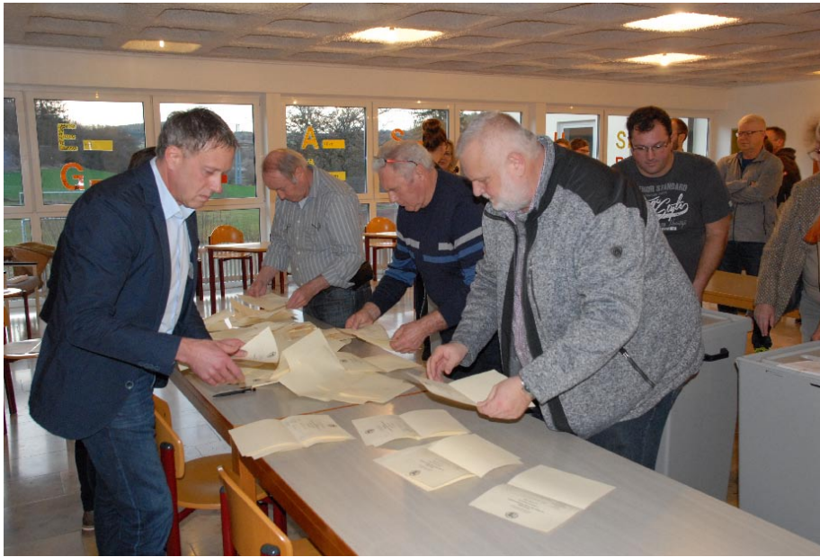
Großer Dank an die sehr zahlreichen ehrenamtlichen Wahlhelfer*innen