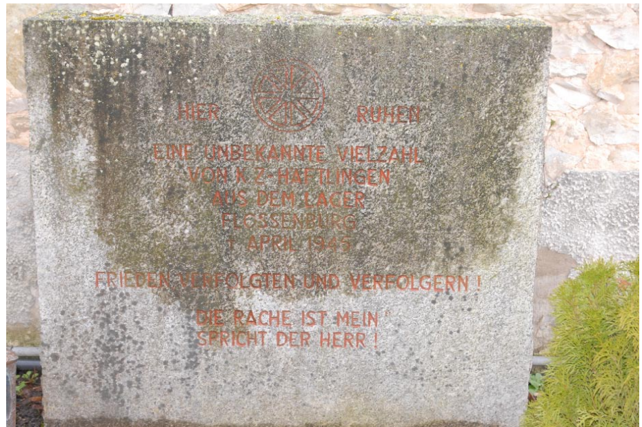
Im Friedhof erinnert noch eine Gedenktafel an die verstorbenen Häftlinge

Für die zurückgebliebenen Häftlinge bedeuteten die wenige Tage später einrückenden Amerikaner die Befreiung. Die Amerikaner betreuten sie besonders fürsorglich. Die ehemaligen Häftlinge wurden im ehemaligen Gasthaus „Goldener Anker“ untergebracht. Auch im alten Schulhaus waren ehemalige Häftlinge untergebracht. Für sieben von ihnen kam die Befreiung zu spät. Sie starben, weil sie die reichlich gelieferte Nahrung nicht vertrugen. Insgesamt wurden schließlich 17 Häftlinge im Friedhof beerdigt. Wie viele Menschen bei diesem Marsch ums Leben kamen, kann nicht mehr exakt recherchiert werden. Ihr Schicksal soll im Landkreis nicht vergessen werden.