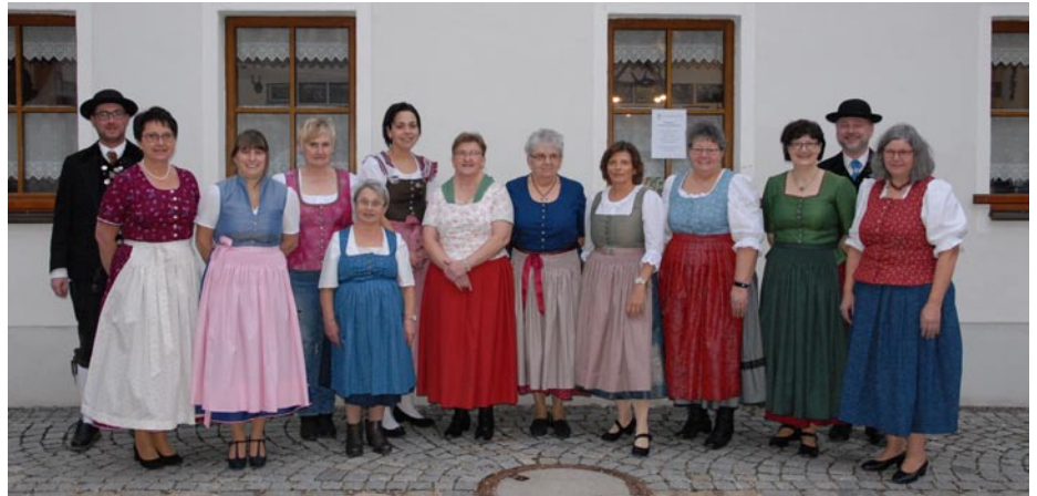
Die Ergebnisse von drei Tagen Trachtennähkurs und zusätzlicher Heimarbeit können sich sehen lassen

Dieser kritische Bericht zeigte Wirkung: Die Oberpfälzer besannen sich auf ihre Tracht und holten vielerorts wieder ihre bodenständige Tracht aus den Truhen und Schränken. In den darauffolgenden Jahren gründeten sich viele Heimat- und Volkstrachtenvereine, die diese Tradition und die Tracht bewahren und pflegen wollen.