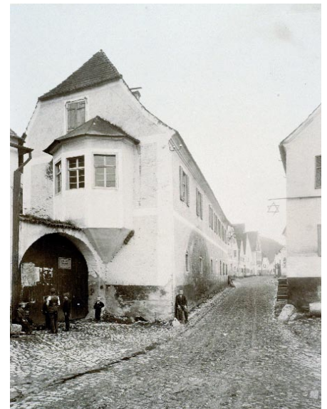
Im ehemaligen Gasthaus „Goldener Anker“ waren nach der Befreiung Teilnehmer des Todesmarsches untergebracht. Viele überlebten ihre Befreiung nicht.

Am 5. April zog der Großteil der Häftlinge wieder ab und durch das Vilstal hinab. Alle Pferdefuhrwerkbesitzer wurden unter Zwang der SS verpflichtet, die nicht mehr gehfähigen Häftlinge zu transportieren. Auch während des Transportes wurden