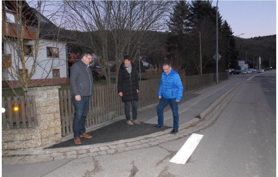
Gehwegabsenkungen wurden bereits realisiert.

Viele kleinere Maßnahmen konnten relativ kurzfristig umgesetzt werden. Ein Beispiel hierfür ist der Friedhof, in dem die Randsteine in einigen Bereichen abgesenkt wurden. Aber auch