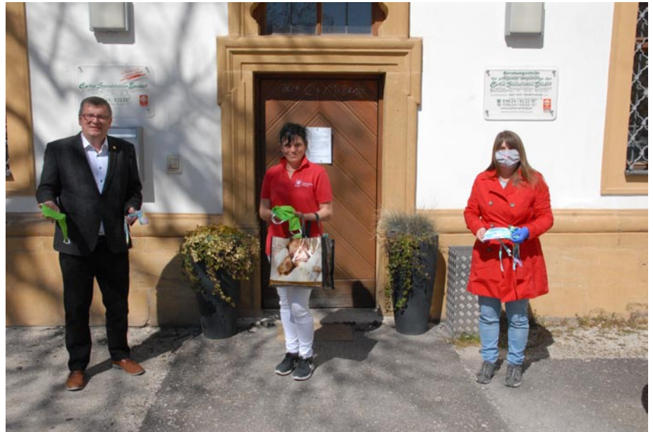
Übergabe an das BRK Seniorenheim in Ensdorf

Die Masken sind in verschiedenen Geschäften in Schmidmühlen verteilt worden und sind kostenlos für die Mitbürger zur Mitnahme erhältlich. Auch die verschiedensten Einrichtungen wie Kindergarten, Nachbarschaftshilfe, Allgemeinarztpraxis und die Feuerwehr wurden beliefert.