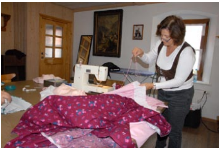
Viele Dirndl sind Unikate

„Sitt und Tracht der Alten, wollen wir erhalten“ – dies haben sich die Trachtenvereine auf ihre Fahnen geschrieben und diesen Leitspruch wollen sie auch leben. Die Frauen und Männer legen großen Wert auf die Traditionen – und das zeigen sie auch mit ihrem G'wand. Und fallen so bei jedem Festzug sofort ins Auge – die Trachtenträger der Heimat- und Volkstrachtenvereine aus der Oberpfalz, die sich mit ihrem Trachtengwand nicht verstecken brauchen. Alle vereint sie nicht nur der tief empfundene Wunsch, Tradition und Brauchtum und damit Werte zu erhalten, sondern auch der Stolz auf das originale Oberpfälzer G'wand, wie man es schon vor mehr als hundert Jahren hatte.